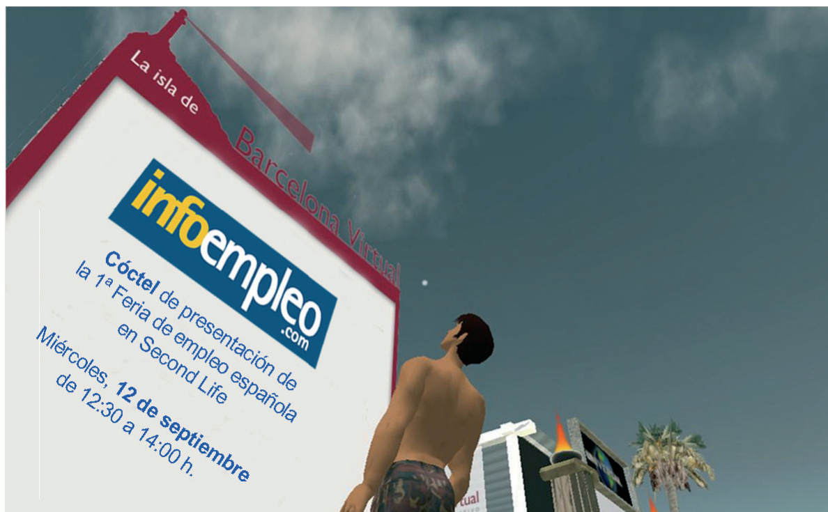
El cóctel de Infoempleo es sólo el paso previo para la futura celebración de la feria.