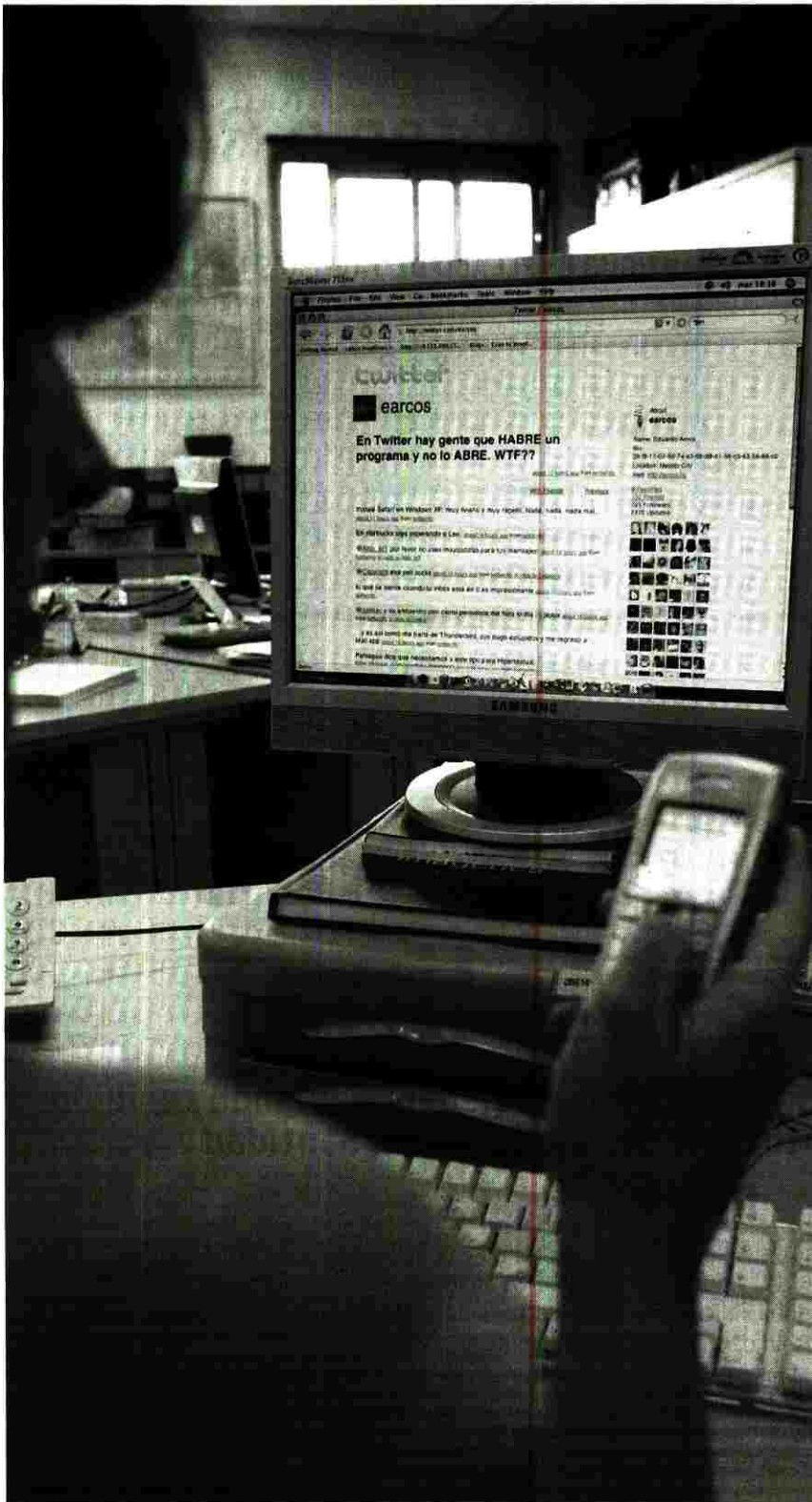
OPCIONES. La página se puede actualizar a través del ordenador, un SMS o servicios de IM.

TEXTO: ESTER REQUENA / MADRID