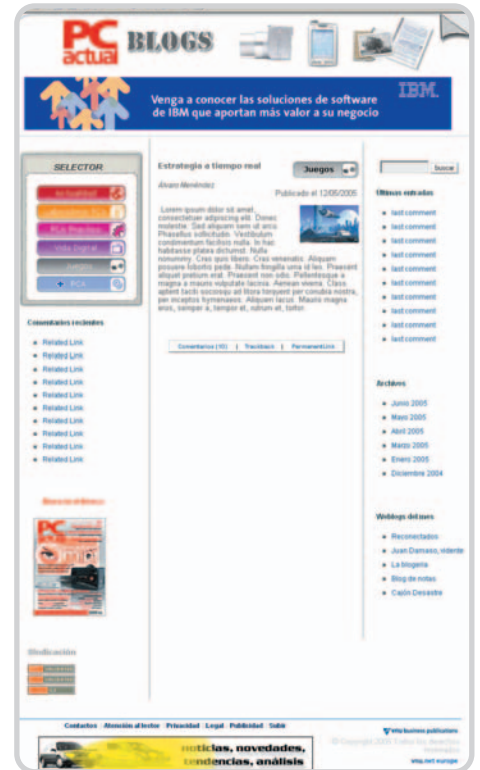
Look and feel del nuevo weblog de PC Actual que estará vigente desde el mes de junio.

En la derecha, encontraremos un buscador para localizar elementos y palabras claves en nuestra web, una sección con el top ten de nuestros weblogs favoritos, así como un enlace directo al archivo de posts clasificado por semanas o días (si llega el caso), por si faltaste ese día a la cita diaria. Más adelante concretaremos todos