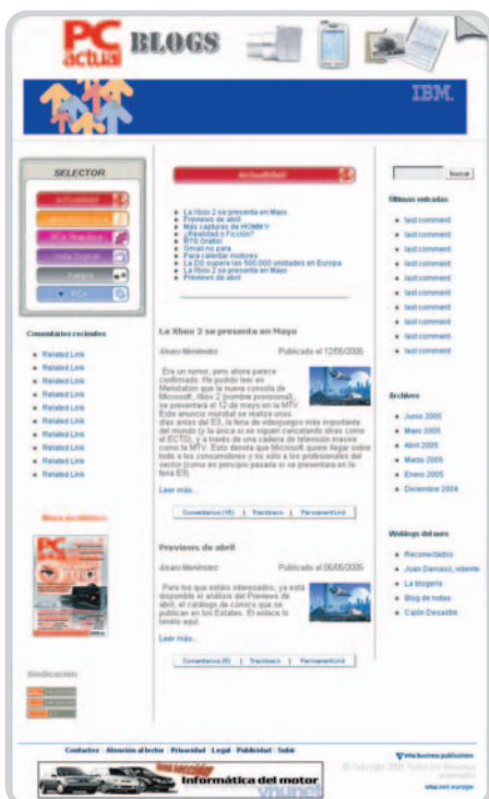
Contamos con tu participación y experiencia para convertir a PCAblogs en un referente informático.