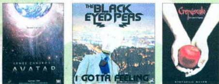
La película, la canción y el libro más pirateados.

Y aún hay más. Los Angeles Times cita un estudio de Media-Control GfK que asegura que entre 2006 y 2008 las descargas ilegales de películas en España pasaron de 132 millones al año hasta los 350 millones. En el mismo periodo de tiempo, el alquiler o venta de películas descendió un 30%. "Ahora, los estudios ven a España como un mercado perdido", sentenciaba.