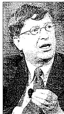
Bill Gates, fundador de Microsoft.

Fuentes de Microsoft se negaron ayer a comentar la operación. No obstante, aseguraron que esto demuestra la fuerza que tiene el software en los dispositivos móviles. "Se están dando cuenta que lo que diferencia un móvil normal de uno muy bueno