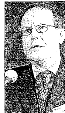
Jorma Ollila, presidente de Nokia.

El grupo adquirido es la única alternativa real a un futuro dominio por parte de Microsoft